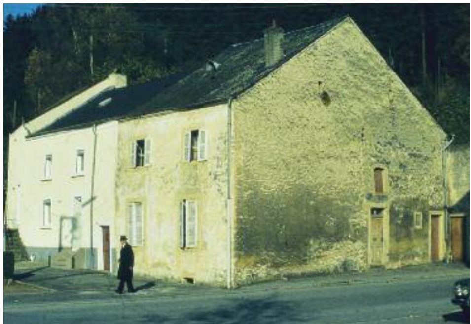
d'Lëintschen a Staffelshaus 1981, dat fréiert Görgenhaus“ (Grange de Kopstal)

Gläich am Ufank wëll ech awer drop hiweisen, dass am Laf vun de leschten 80 Joere besonnesch dräi Auteuren iwwert d'Weekräizer vu Koplescht geschriwwen hunn; dien ee méi, dien anere manner. Allerdéngs huet kee vun deenen dräi d'Kräizer all erimmt. Mir als „Koplescht - fréier an hott“ sinn lech, eise Lieser, et awer schëlleg, lech dëst Thema nom neiste Stand an esou komplett ewéi méiglech z'offréieren, ouni dobäi den Do-