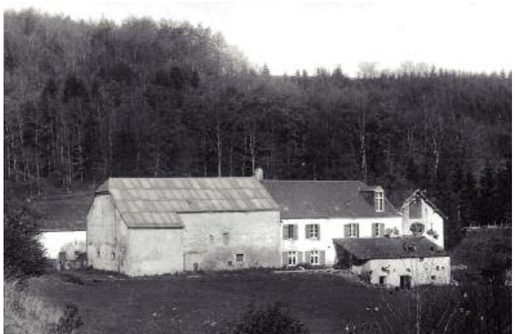
D'Hemèssemillen vun der Plattform vun der geplangter Gare « Koplescht » aus gesinn

Bis an déi klengsten Einzelhet war alles geplangt: d'Garen, de Präis fir d'Billjeën an d'Vitesse vum Zuch. An de Krichsjoueren 1914-1918 gouf mam Bau vun der Bunn ugefaang. Hannert Stroossen, duerch de Gaaschtgronn bei d'Neimaxmillen hunn Aarbéchter d'Fëllementer fir d'Bunn an eng