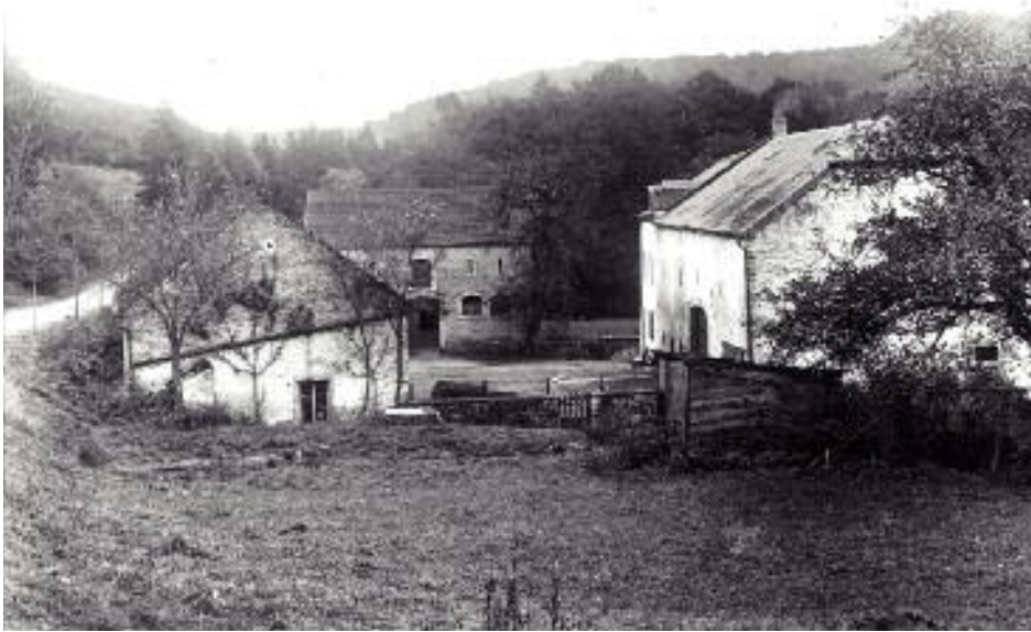
D'Hemèssemillen ëm d'Joer 1950 - Kollektioun Théo Warnier