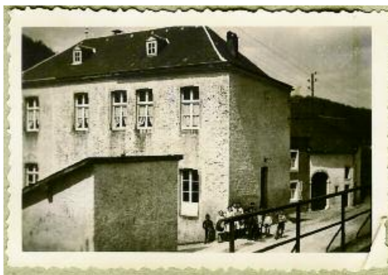
d'Schoul am Eck

Um Parterre war de Schoulsall. Do hun déi Kopleschter an déi Brideler Bouwen vum éischte bis zum drëtte Schouljoer Liesen a Schreiwene a Rechne geléiert. Déi Lidder, déi se an de Gesangstonne geprouwt hun, huet de Willy op