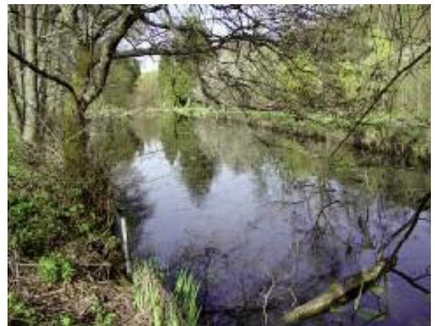
De Weier vun der „Weidemillen“, die vun de Quellen aus dem Bichebësch säi Waasser kritt