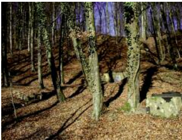
De Bësch bei der Dauschkoll zum Muesbiërg hei mat den 3 Quellfaassungen K-23-24-25

Dësen Artikel soll net als eng wëssenschaftlech Etude verstane ginn. Et ass eng Duer-